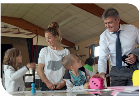
... et pour les grands ! (Ecoacteurs en Médoc)