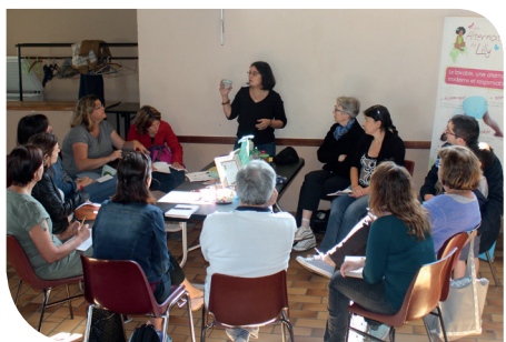
Les conseils zéro déchet proposés par « Les alternatives de Lilly » ont rencontré un grand succès.

conseils simples et pratiques présentés à travers de multiples animations. Beaucoup ont découvert que l'on pouvait très facilement réduire le gaspillage, supprimer des déchets et... faire de grosses économies !