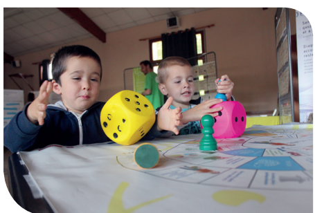
Un jeu pour apprendre à mieux manger pour les petits...