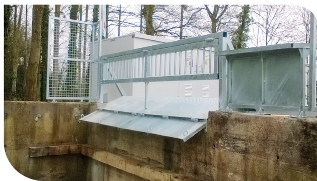
L'aménagement du quai de dépôt des gravats permettra le déchargement des remorques.