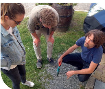
L'association OSE proposait de (re)découvrir les plantes des trottoirs et leur importance pour la biodiversité.